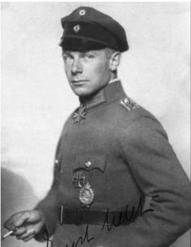
Der pilot Ernst Udet (1896-1941)

Im Jahre 1914 wurde das Haus durch die deutsche Armee requiriert, so konnten sich einige Soldaten des Flugplatzes Rixheim-Habsheim hier einquartieren. Vom November 1915 bis Februar 1917 lebte hier der Flieger Ernst Udet, "wie Gott in Frankreich", schrieb er in seiner Denkschrift. Über Rixheim erhielt er seinen ersten Sieg, den 18ten März 1916. Udet ist der zweit grösste Held der deutschen Luftwaffe im Ersten Weltkrieg mit 62 anerkannten Abschüssen, gegen 80 für den Baron Manfred von Richthofen, genannt den "Roten Baron".